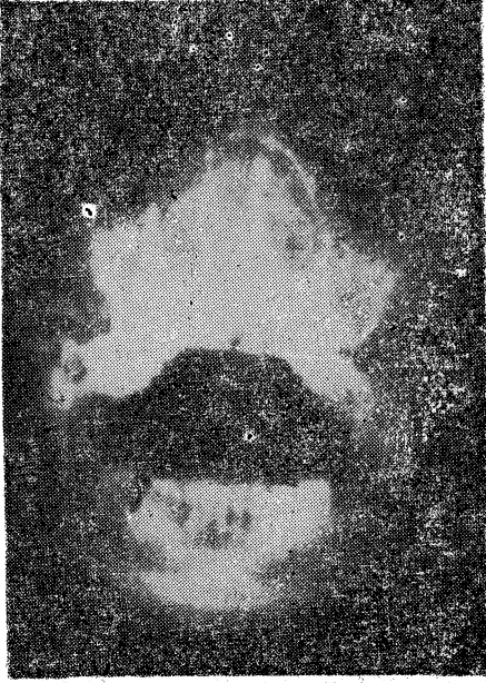
Resim 1. Water's grafı (Preop.)

Water's grafide (Resim 1) burun yan duvarlarını laterale doğru iten, nazal septumu destrukte eden kitle mevcuttu. Sol maksiller sinüs kapalı, sağ maksiller sinüs alanı daralmış ve sfenoid sinüsler görülmemektedir. Kemiklerde erozyon görülmedi.