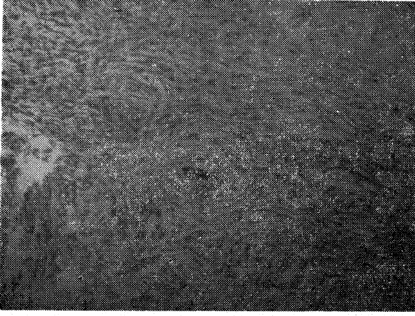
Resim 3. Vakanın mikroskopik görünümü (H ve E. x100. Pat. prot. no: 574/87).

sı tarif edilmiştir. Mikroskopik olarak ise spindl şeklindeki fibroblastların birbirleriyle karışan demetler ile helezon şeklinde konsantrik yapılar oluşturduğu izlenmiştir (Resim 3).